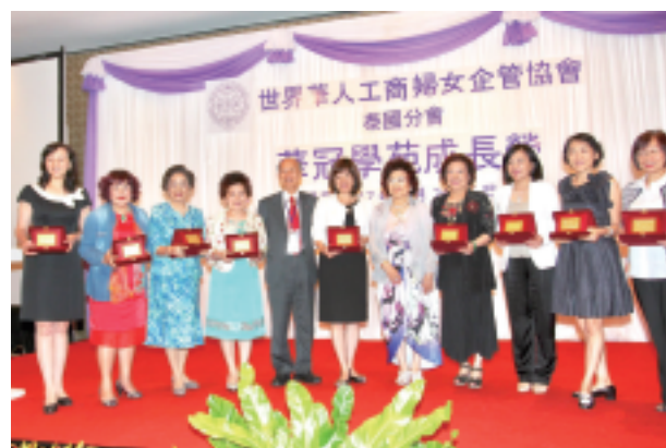
2017泰國華冠學苑成長營