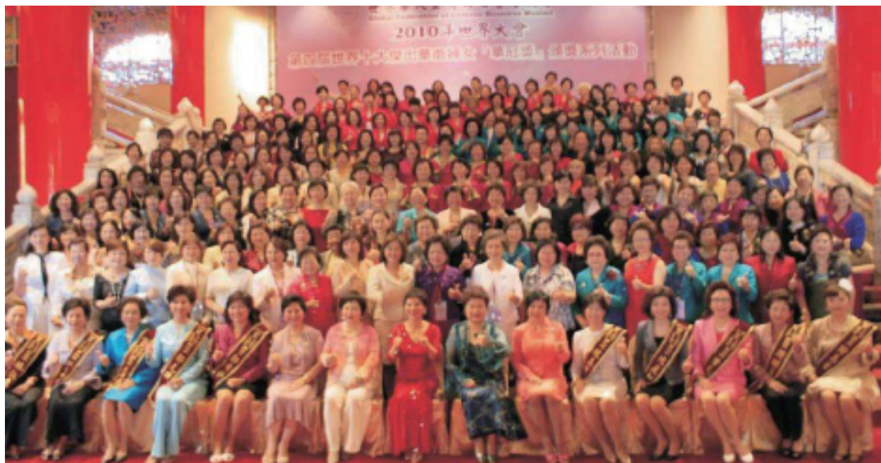
2010年世界年會暨第四屆【華冠獎】表揚活動大合照