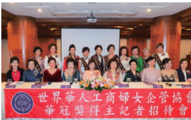
華冠獎得主記者招待會