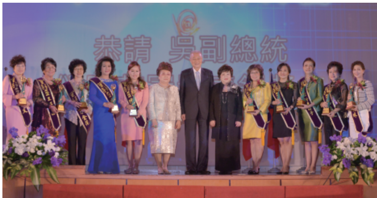
第五屆【華冠獎】吳敦義副總統親臨頒獎