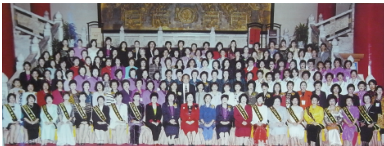
2001年世界年會暨第一屆【華冠獎】表揚活動大合照