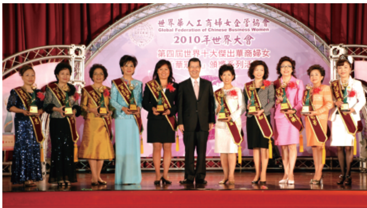
第四屆【華冠獎】蕭萬長副總統親臨頒獎