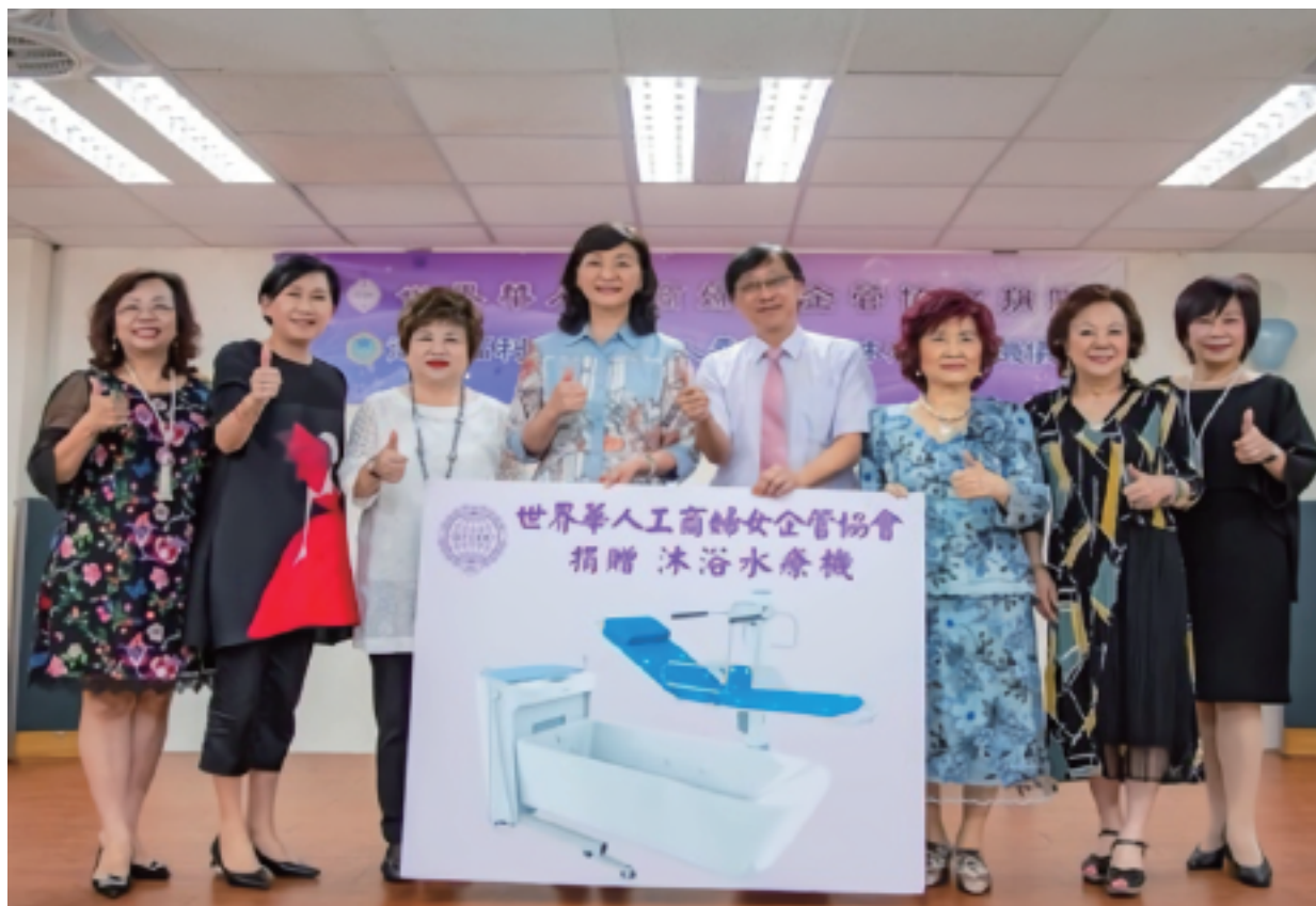
2019捐贈『彰化老人之家』醫療沐浴水療機

歷屆【華冠獎】得主，都將當選視為責任的起點，在獲獎後發揮「利他」的崇高價值與意義，積極投入社會公益的關懷。無論是在經貿表現、社會穩定、弱勢扶植、環保追求上，都有許多的貢獻；對於女性關懷更投入許多心力，透過座談演講、媒體專訪報導、出書立傳，在全球各地分享事業經營之道、與突破困境的生命智慧，產生激勵與教化人心的功能，幫助婦女同胞找到積極的生命動能，讓【華冠獎】的榮光持續在世界各地閃耀。