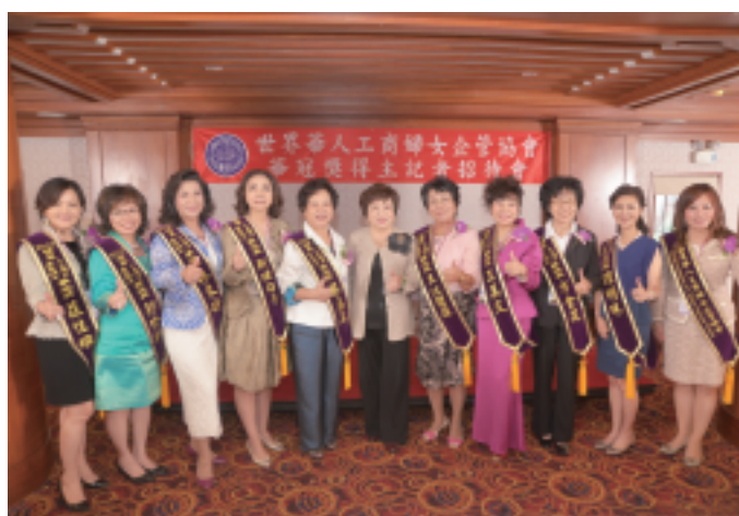
華冠獎得主記者招待會