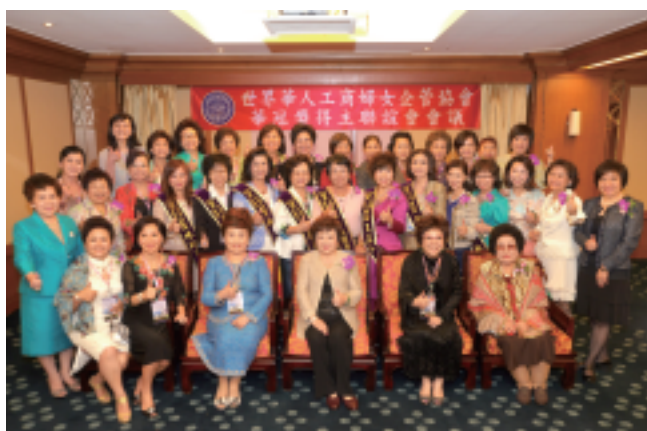
2013華冠獎得主聯誼會