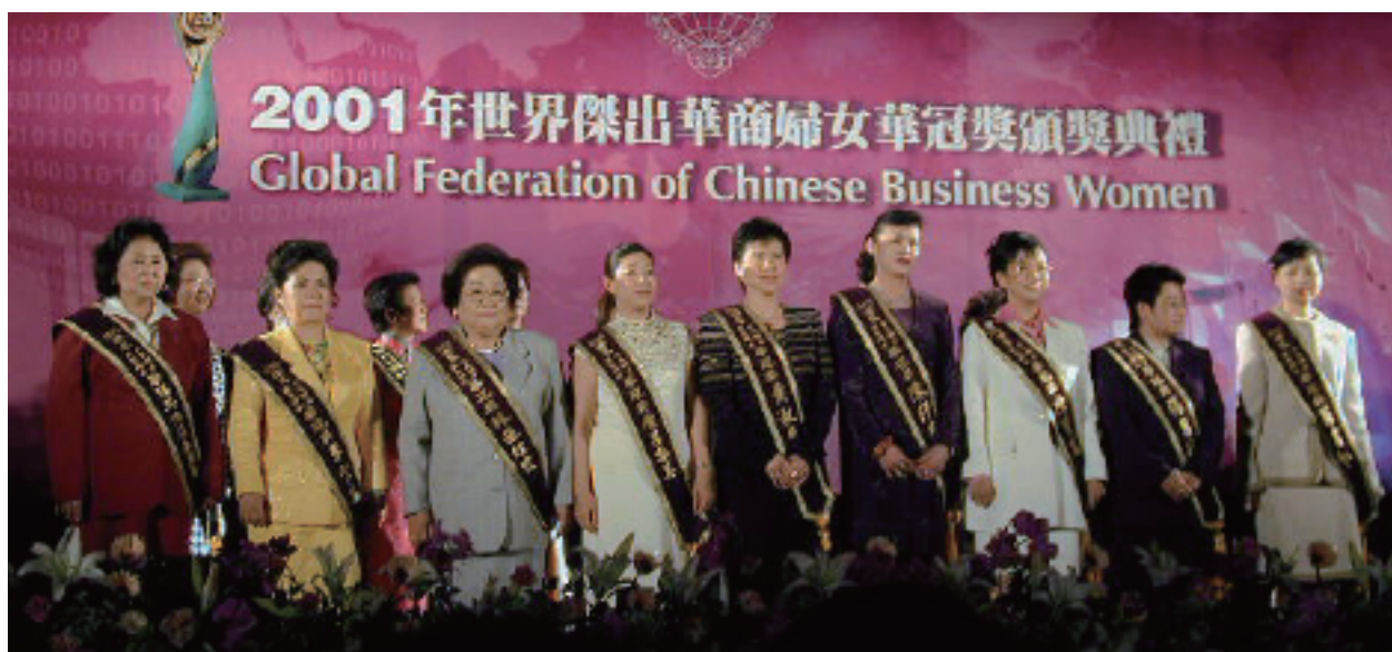
第一屆【華冠獎】得主合影