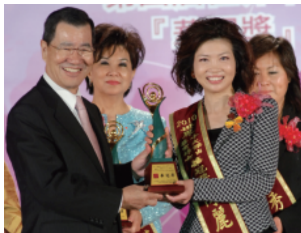
蕭萬長副總統親臨頒獎