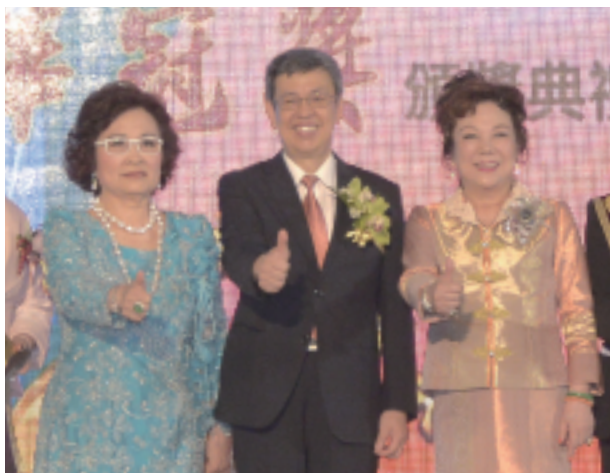
陳建仁副總統親臨頒獎