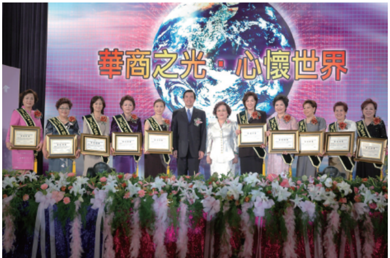
馬英九先生蒞臨頒發華冠獎牌

藉由此項全球最高榮譽的表揚活動，除了可以彰顯婦女菁英創業成功的艱辛歷程及優良特殊貢獻外，更可作為鼓勵全球華商婦女群起效尤、見賢思齊、突破困境之典範；並凝聚全球婦女工商菁英之力量，回饋國家，關懷地球，意義非凡。