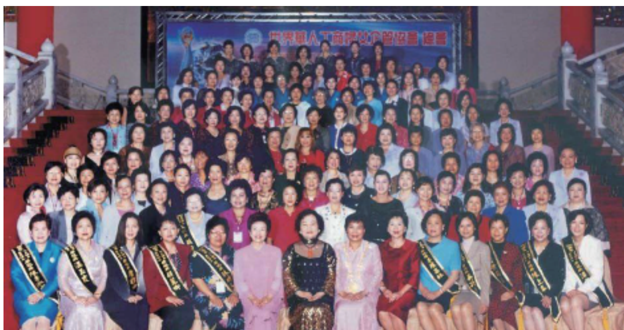
2004年世界年會暨第二屆【華冠獎】表揚活動大合照