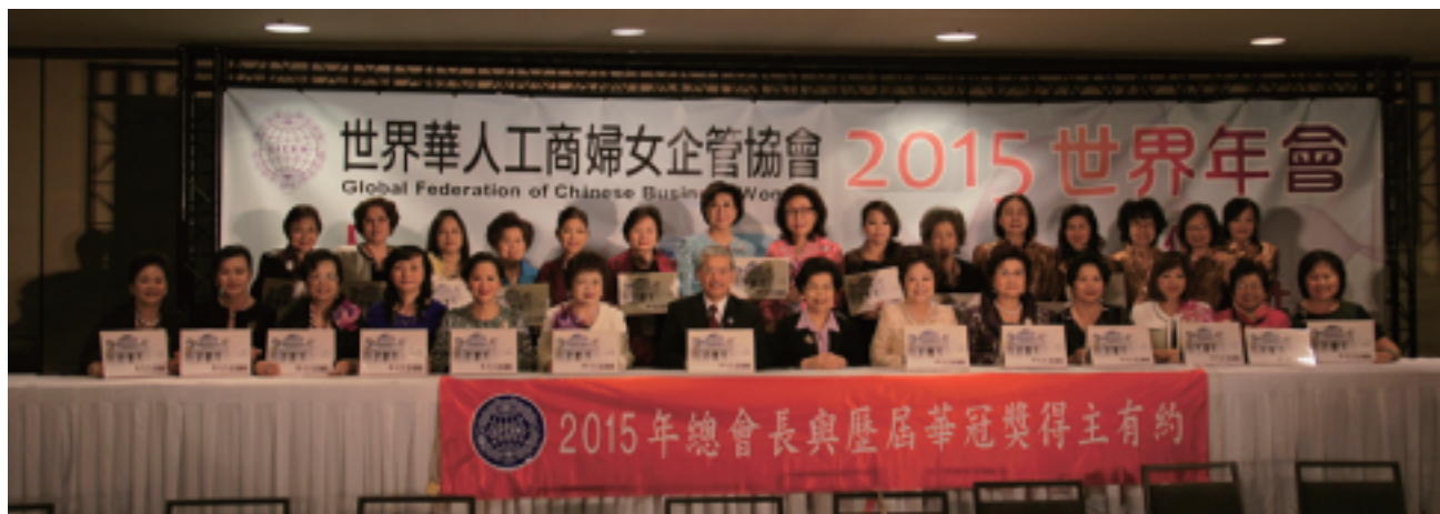
2015 LA世界年會-總會長與華冠得主早餐會