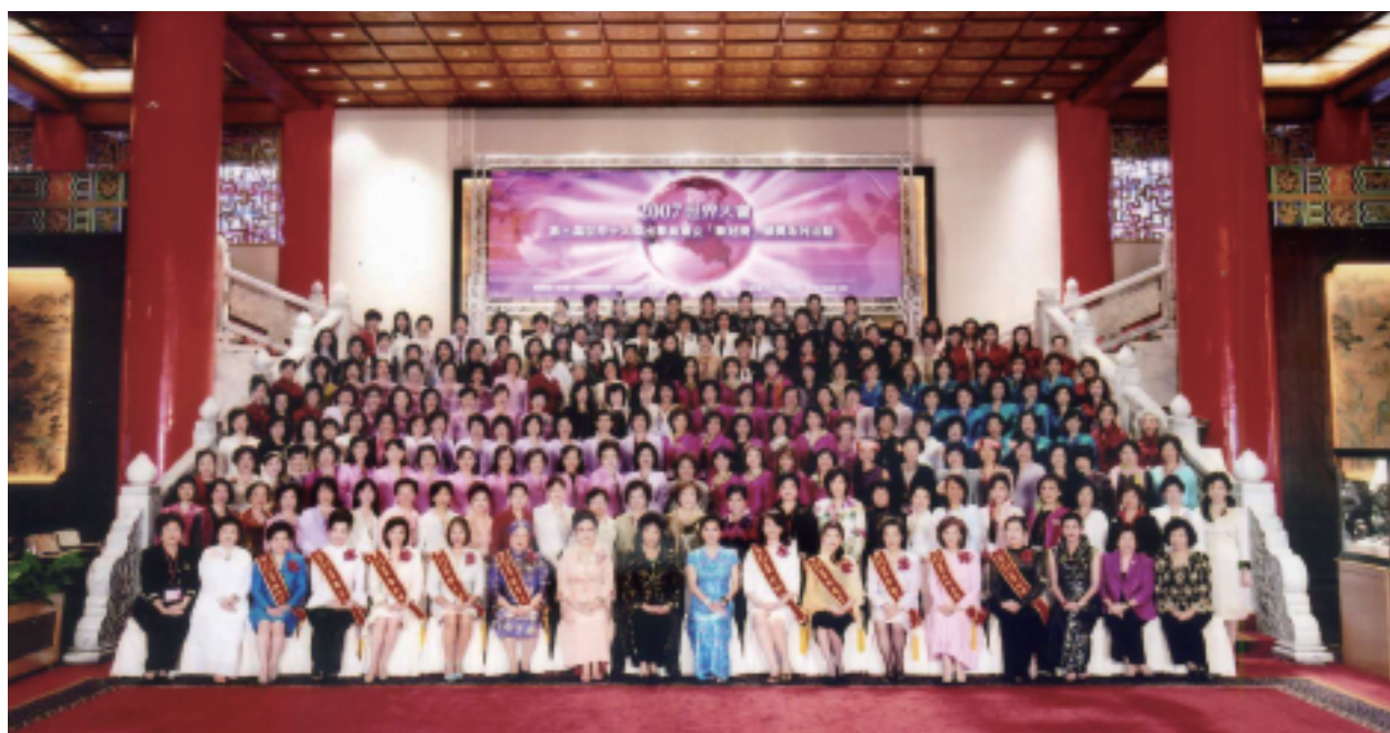
2007年世界年會暨第三屆【華冠獎】表揚活動大合照