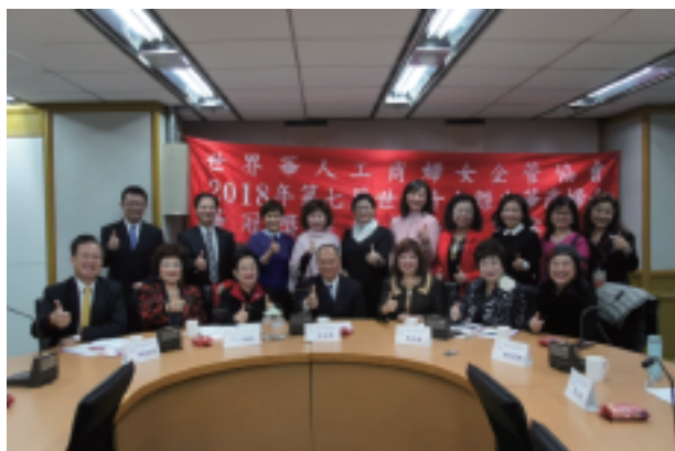
第七屆評審委員合照