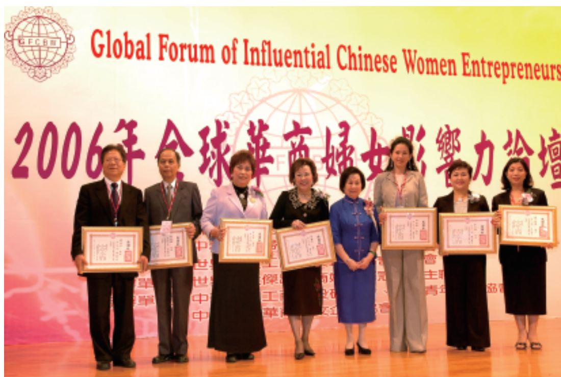
2006全球華商婦女影響力論壇