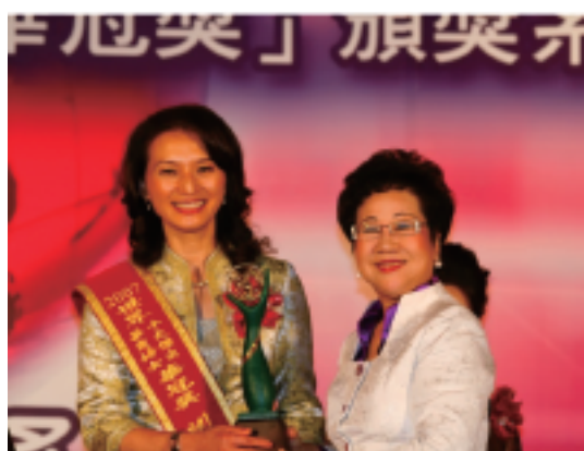
呂秀蓮副總統親臨頒獎