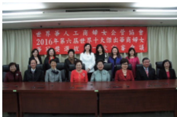
第六屆評審委員合照