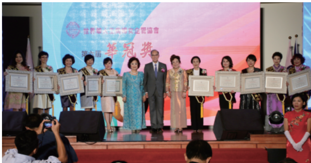
第六屆【華冠獎】外交部李大維部長親臨頒獎