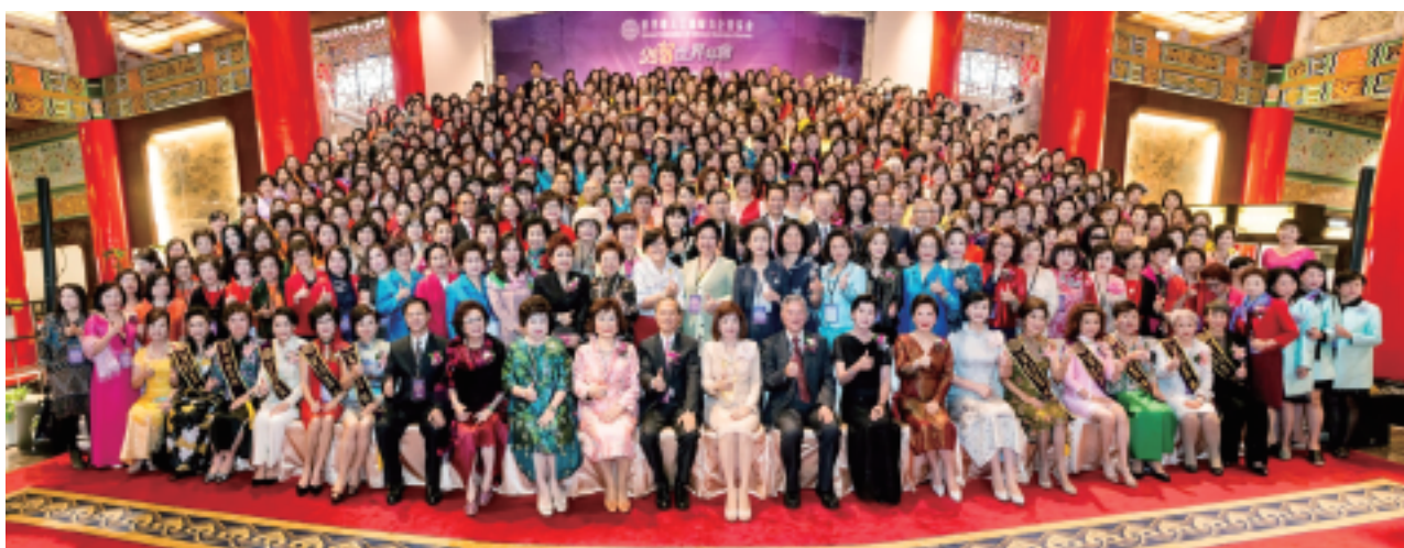
2018年世界年會暨第七屆【華冠獎】表揚活動大合照