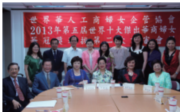
第五屆評審委員合照