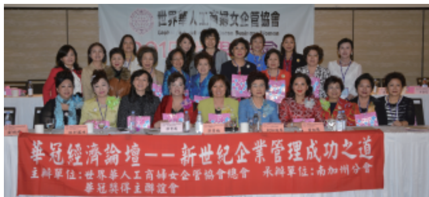
2015 LA世界年會-華冠經濟論壇