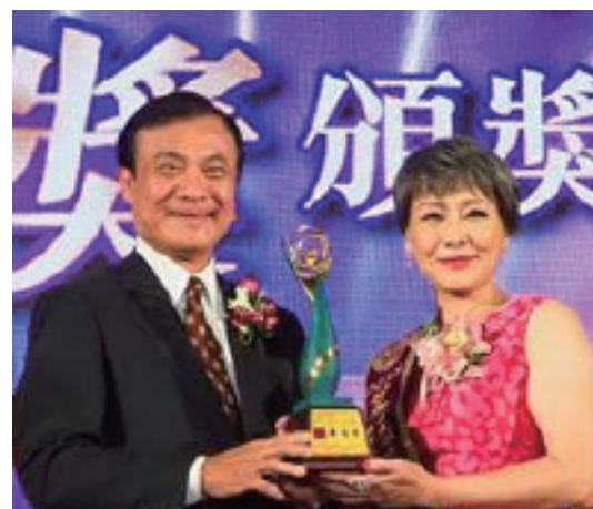
立法院蘇嘉全院長親臨頒獎