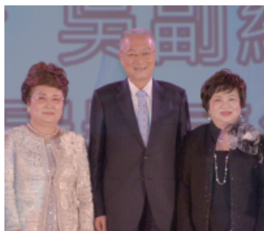
吳敦義副總統親臨頒獎