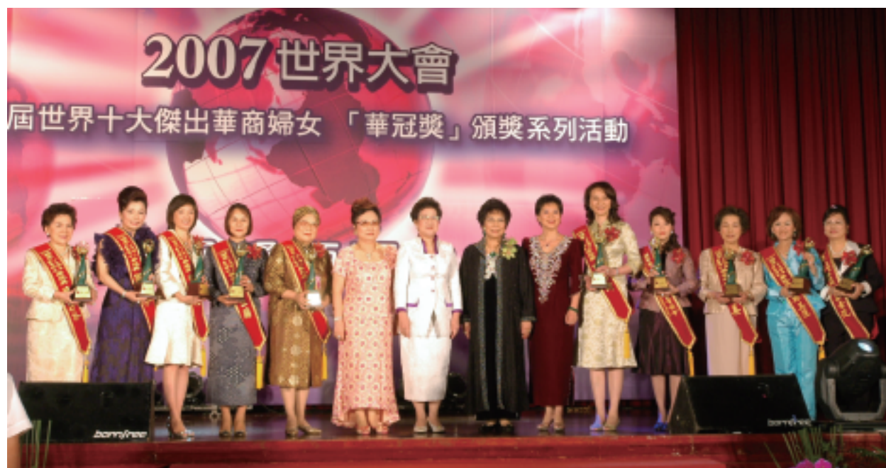
第三屆【華冠獎】呂秀蓮副總統親臨頒獎