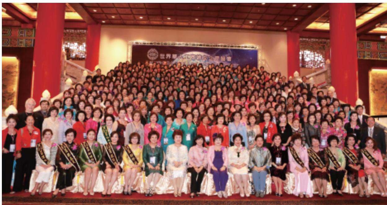
2013年世界年會暨第五屆【華冠獎】表揚活動大合照