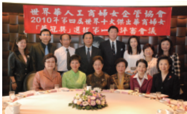
第四屆評審委員合照