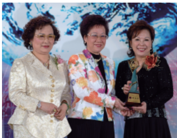
呂秀蓮副總統親臨頒獎