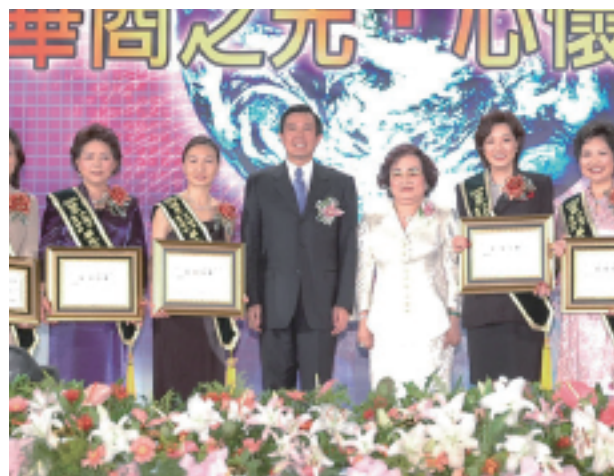
馬英九市長親臨頒獎