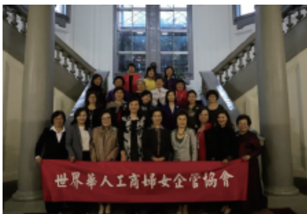
2018拜訪監察院與張博雅院長合影

【華冠獎】得主的誕生，不僅充份展現華商婦女的典範，更象徵著全球婦女追求卓越的標竿。秉持「飲水思源」心念，在與【世華】組織結緣後，深刻感受到總會嘉惠全球華商姐妹的心念，在得獎後更成為【世華】組織分佈於全球各地的忠實支持者，甚至是積極的參與者與貢獻者。