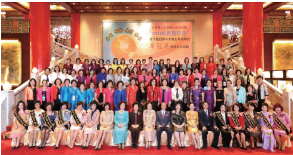
2016年世界年會暨第六屆【華冠獎】表揚活動大合照